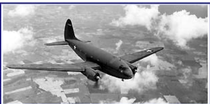
Septembre / September / September 2011