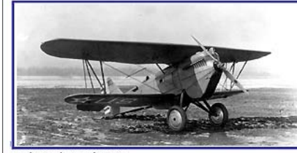
Avril / April / April 2011