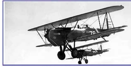
Fevrier / February / Februar 2011