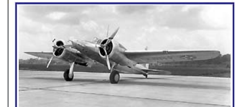
Decembre / December / Dezember 2011