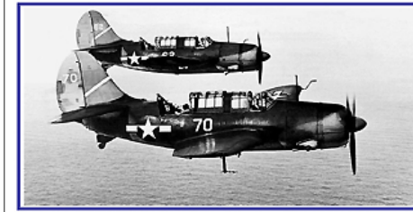
Aout / August / August 2011