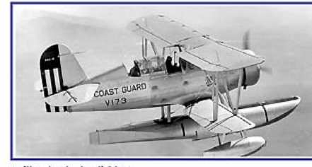
Juillet / July / Juli 2011