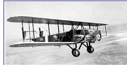
Mars / March / März 2011