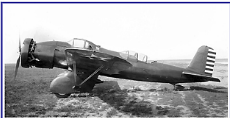
Mai / May / Mai 2011