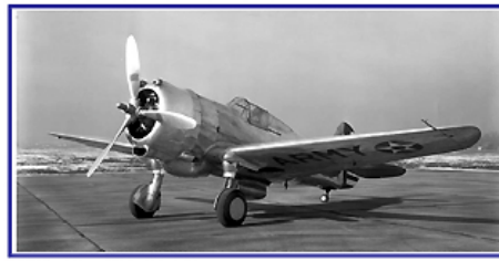
Juin / June / Juni 2011