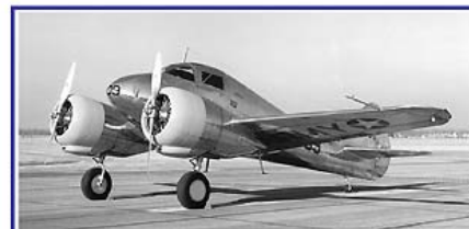
Novembre / November / November 2011