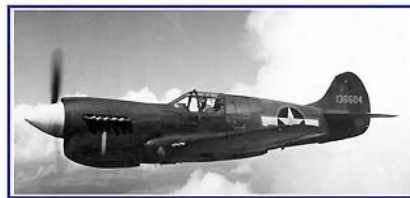
Octobre / October / Oktober 2011