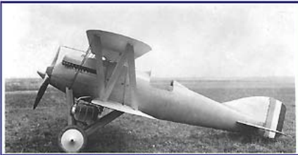
Janvier / January / Januar 2011